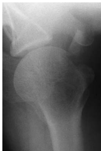
図二 単純X線軸写像