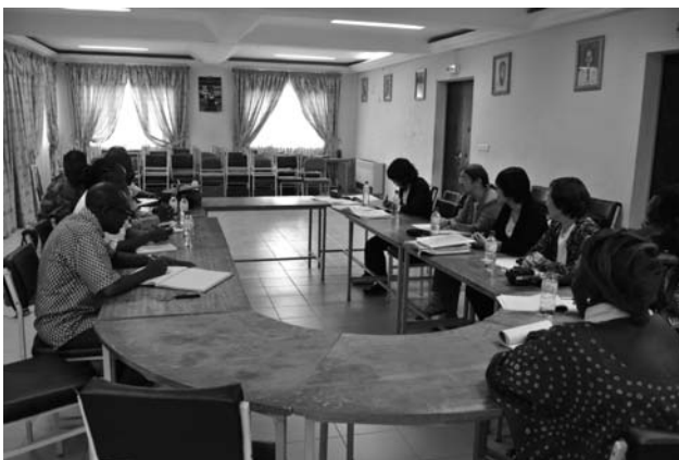
写真1 研修生と情報交換（ENSPワガドゥグ校にて）

※保健社会向上センターとは、ブルキナファソの保健医療の一次施設であり、5000人に対して1施設の設置を目標としている。疾病や負傷の外来診療、産前/産後健診や正常分娩などの妊産婦ケアなどが行われている 3) 。