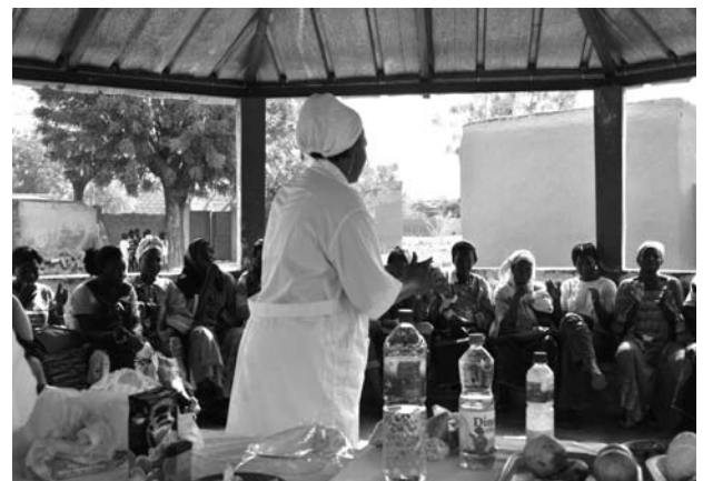
写真2 母親学級の様子（テンコドゴ保健社会向上センター）

以上の活動を、一年半という短期間で実施したカム2010研修生の努力と周囲の協力について、高く評価できる。また、本学で行っている研修が仏語圏アフリカの母子保健に寄与していることを再確認できた。さらにこのテンコドゴでの活動が他の地域に波及効果をもたらす可能性も示唆された。