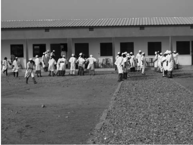
写真4 ENSPテンコドゴ校

心を持っており、今後テンコドゴ校がENSPのモデル校となることで、ブルキナファソ全体の母子死亡率の低下に寄与できると述べた。教職員からは、教育機材が不足しており機材供与を期待しているが、現地の実情に即し、ニーズを考慮して機材を検討してほしいとの依頼があった。